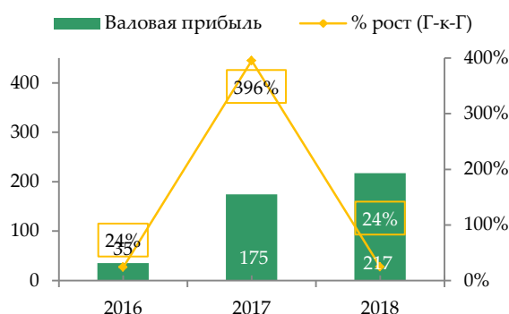
Валовая прибыль (в млрд. тенге)