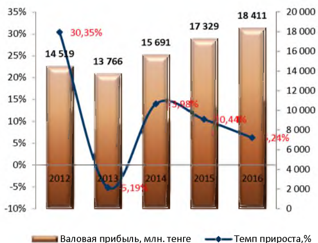
Динамика изменения валовой прибыли