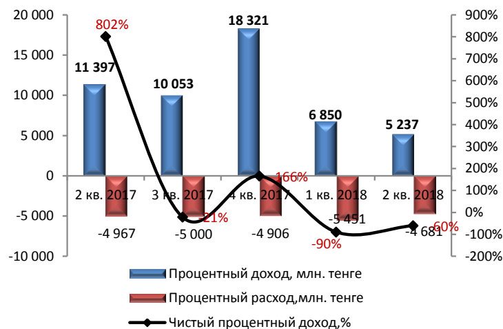
Динамика чистого процентного дохода (без кумулятивного эффекта)

Незначительные расхождения между итогом и суммой слагаемых объясняются округлением