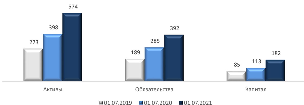
Динамика рынка МФО (активы, обязательства, капитал), млрд.тенге

Совокупные активы МФО на 01 июля 2021 года составили 644 млрд. тенге, показав прирост на 46% в сравнении с аналогичным показателем прошлого года. На долю десяти крупнейших микрофинансовых организаций приходится 73% активов отрасли МФО.