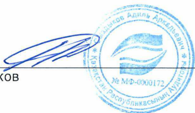
Адиль Сыздыков Аудитор

Квалификационное свидетельство аудитора № МФ - 0000172 от 23 декабря 2013 года