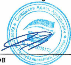
Адиль Сыздыков Аудитор

Квалификационное свидетельство аудитора № МФ - 0000172 от 23 декабря 2013 года