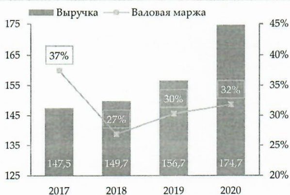
Динамика выручки (в млрд. тенге)