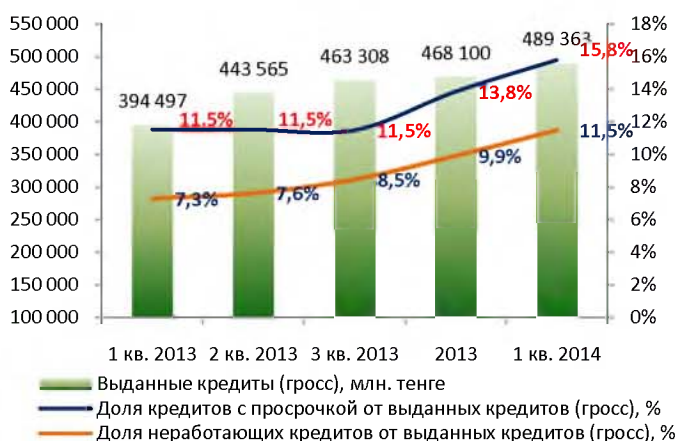
Качество ссудного портфеля