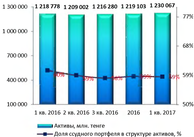
Доля ссудного портфеля в структуре активов, % (МСФО)