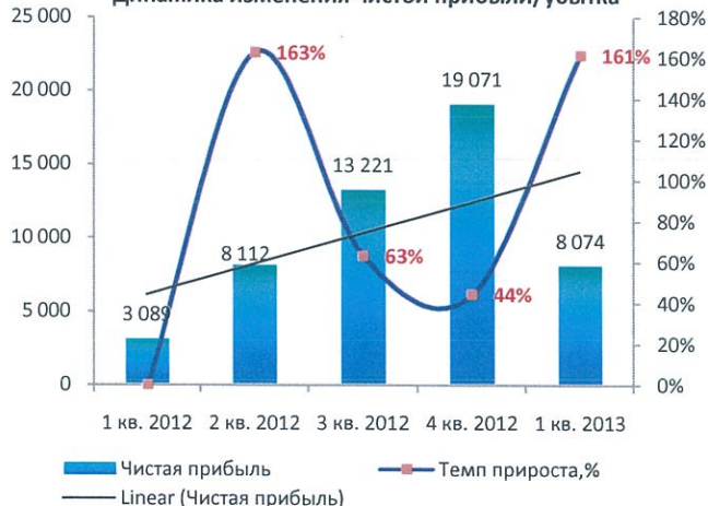
Динамика изменения чистой прибыли/убытка