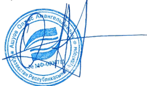
Олжас Ашуов Аудитор-исполнитель

Из тех вопросов, которые мы довели до сведения лиц, отвечающих за корпоративное управление, мы определяем вопросы, которые были наиболее значимыми для аудита консолидированной финансовой отчетности за текущий период и, следовательно, являются ключевыми вопросами аудита. Мы описываем эти вопросы в нашем аудиторском заключении, кроме случаев, когда публичное раскрытие информации об этих вопросах запрещено законом или нормативным актом или когда в крайне редких случаях мы приходим к выводу о том, что информация о каком-либо вопросе не должна быть сообщена в нашем заключении, так как можно обоснованно предположить, что отрицательные последствия сообщения такой информации превысят общественно значимую пользу от ее сообщения.