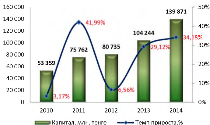
Динамика изменения капитала