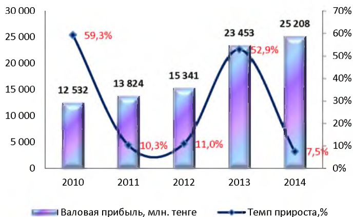
Динамика валовой прибыли