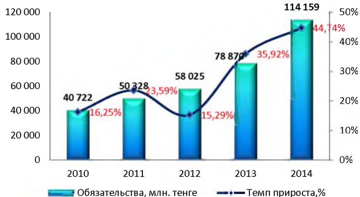
Динамика изменения обязательств