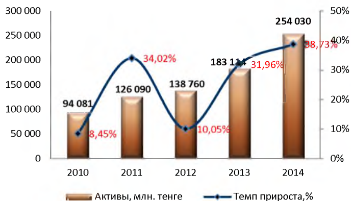
Динамика изменения активов