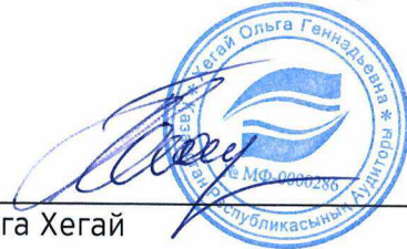
Ольга Хегай Аудитор

Квалификационное свидетельство аудитора № МФ-0000286 от 25 сентября 2015 года