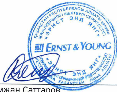
Рустамжан Саттаров Генеральный директор ТОО «Эрнст энд Янг»

Государственная лицензия на занятие аудиторской деятельностью на территории Республики Казахстан серии МФЮ 2, № 0000003, выданная Министерством финансов Республики Казахстан 15 июля 2005 года