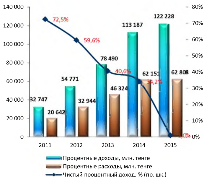
Динамика чистого процентного дохода