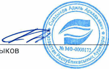
Адиль Сыздыков Аудитор

Квалификационное свидетельство аудитора №МФ-0000172 от 23 декабря 2013 года