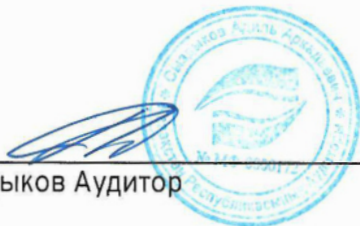
Адиль Сыздықов Аудитор

Аудитордың 2013 жылғы 23 желтоқсандағы № 0000172 біліктілік куәлігі